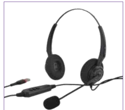
Art. Nr. AH12U

Alcatel-Lucent ist erhältlich bei Ihrem Fachhändler: