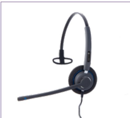
Art Nr. AH21U