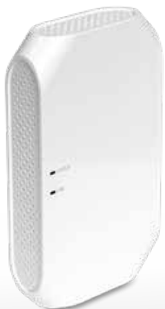
Art. Nr. 1201H