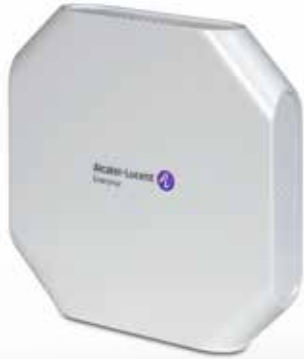
Art. Nr. 1101