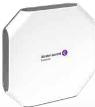
Art. Nr. 1201